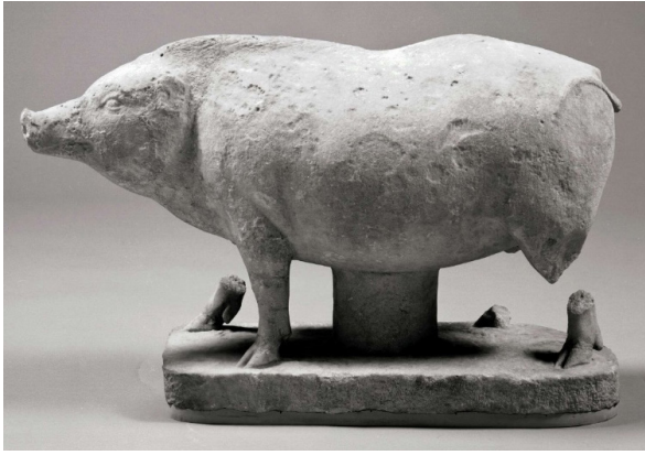
Görsel 9 Domuz heykelciği, British Museum, Londra

Domuz heykelcikleri ile Demeter ritüellerinin ne ilişkisi var? Bunun cevabını Hades'in (Plouton'un) Kore'yi kaçırdığı mitolojik hikayede buluyoruz.