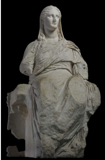
Görsel 1 Demeter, British Museum, Londra

Yunan dünya görüşüne ait bu mitolojik hikaye; bir anne ile bir kızın arasındaki sevgiyi tema ederek doğanın canlanışını, bereketi, mevsim döngüsünü sembolize eder. Doğanın kış mevsiminin durgunluğundan bahar mevsiminin hareketliliğine geçişi, mitolojik bir bağlantı ile tanrıların bir işi olarak anlatılır.