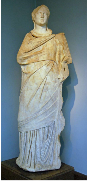
Görsel 6 Rahibe (?) Nikokleia, British Museum, Londra

Knidos'ta onuruna bir kült kurulmuş olan bir tanrı ya da tanrıçanın, rahibelik sisteminin bulunması da gereklidir tabii