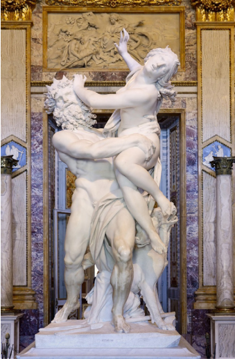
Görsel 3 Persephone'nin (Proserpina) Kaçırılması, Gian Lorenzo Bernini (1621-1622) Galleria Borghese, Roma

MÖ 4. yüzyıla (yaklaşık 330'lu yıllara) tarihlenen Demeter heykeli mermerden yapılmıştır ve tanrıça bir taht üzerinde oturur durumda tasvir edilmiştir. Heykelda Demeter'in yüzü ve bedeni, ayrıca tahtın büyük bölümü oldukça iyi korunmuştur. Yine MÖ 4. yüzyıla (yaklaşık 350-330) tarihlenen Kore heykeli ise neredeyse eksiksiz olarak günümüze ulaşmıştır.