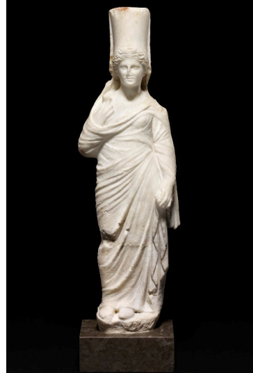
Görsel 2 Kore (Persephone), British Museum, Londra

19. yüzyılın ortalarında Knidos'ta bulunan, Demeter ve Kore heykelleri bugün British Museum'da sergilenmektedir. Envanter