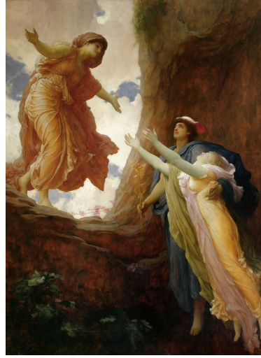
Görsel 4 Persephone'nin Dönüşü, Frederic, Lord Leighton, (1890-1891) Leeds Art Gallery, Leeds

Kore'nin kaçırılması, daha sonra Avrupa sanatını da önemli ölçüde etkilemiştir; 17. yüzyıl heykelturaşlarından Gian Lorenzo Bernini'nin, bugün İtalya Roma'daki Galleria Borghese'de bulunan "Rape of Proserpina" (Proserpina'nın Kaçırılması) adıyla bilinen eseri (1621-1622), Avrupa plastik sanatının önemli eserlerinden biridir. Proserpina, Kore ya da Persephone'nin Latince karşılığıdır. Yine Persephone'nin yeraltından annesine,