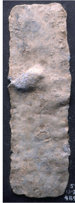
Görsel 11 Antigone'nin lanetleme yazıtı, British Museum, Londra

Buraya kadar yazıtın A yüzündeydik. Geçelim B yüzüne. B yüzünde, lanetlemeyi yapan kadının ismini öğreniyoruz; Hegemone. “Ben Hegemone, Rhodokles bahçelerinde kaybettiğim bileziği Demeter’e ve Kore’ye ve tüm tanrı ve tanrıçalara adıyorum” diye başlıyor yazıt. Anlaşıldığı kadarıyla Hegemone, Rhodokles bahçeleri adı verilen yerde bir bilezik kaybetmiş ve bulan kişi de bileziği geri getirmemiş. Bulan kişinin bileziği geri getirmesi durumunda her şeyin özgür ve helal olmasını isteyen Hegemone “Ama eğer bileziğimi bulan kişi onu iade etmezse ve o bileziği satar ise işte o zaman Demeter, Kore ve onların yanındaki tüm tanrılar ve tanrıçaların öfkesine maruz kalsın” ifadesiyle bu lanetlemesini