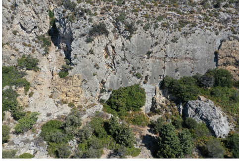
Görsel 5 Demeter Açık Hava Kutsal Alanı

Knidos'ta, kentin biraz doğusunda Demeter'e adanmış bir açık hava kutsal alanı bulunmaktadır. Kutsal alanda, dik bir dağ yamacına açılmış nişler bulunur. Muhtemelen bu nişlerin içine külte ait heykeller konulmuştu. Bu kutsal alan, tanrıçanın onuruna düzenlenen ritüeller için kullanılmıştır.